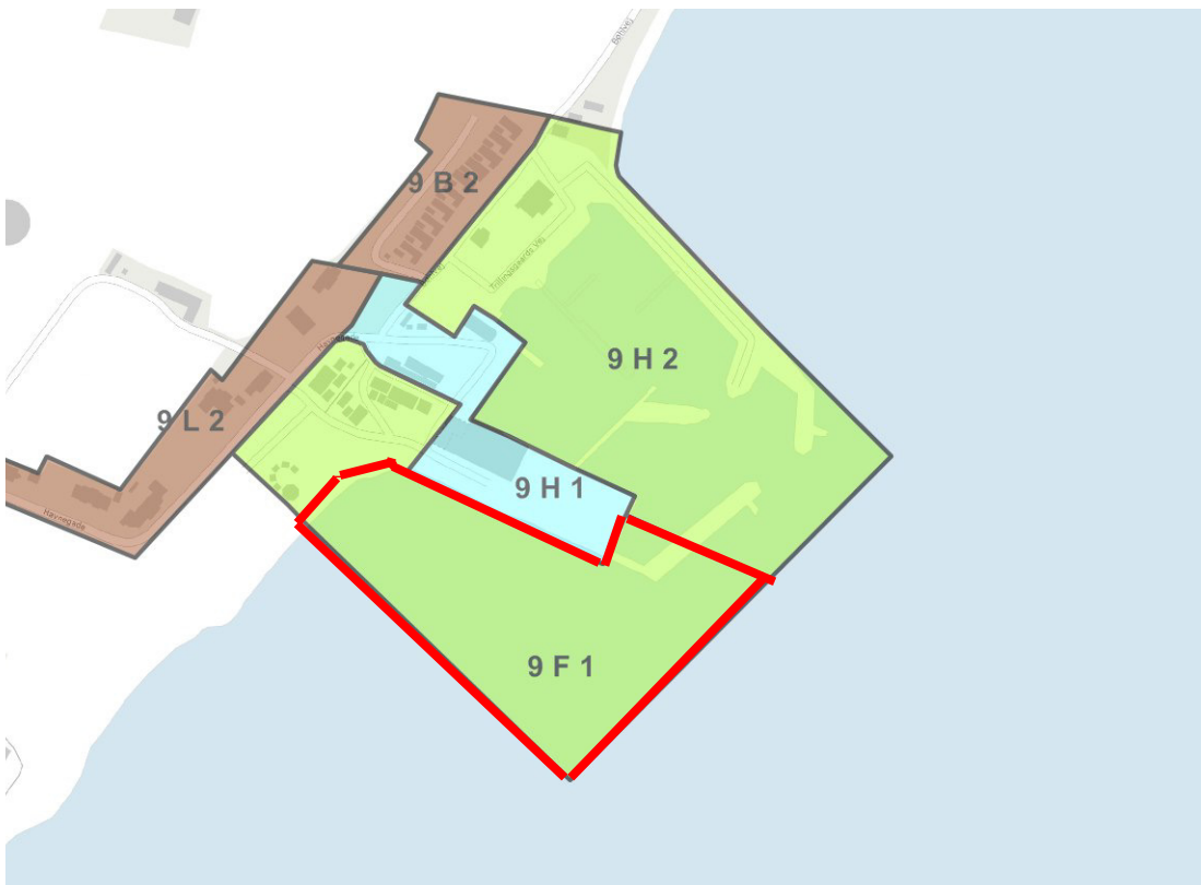
Del af ramme 9 F 1 der aflyses